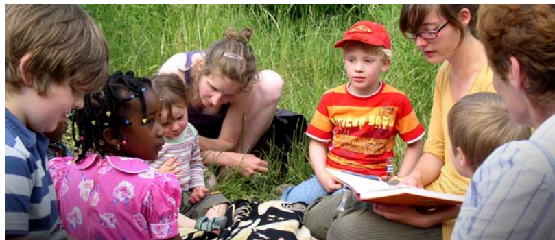
Impressionen vom 3. Naturgartenfest am 6.9.2008 auf der Brachfläche „Werner-Uhlworm-Straße“