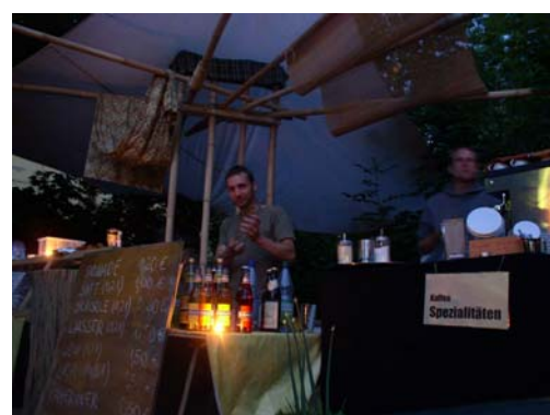
Impressionen vom Afrikatag am 7.6.2008 auf der Brachfläche „Werner-Uhlworm-Straße“