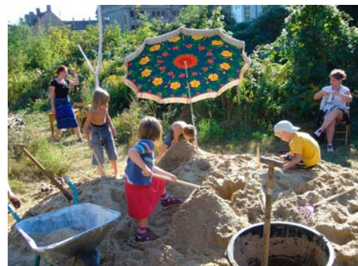
Impressionen vom Naturgartenfest am 24.9.2006 auf der Brachfläche „Werner-Uhlworm-Straße“